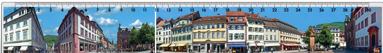
Motiv Nr. 4