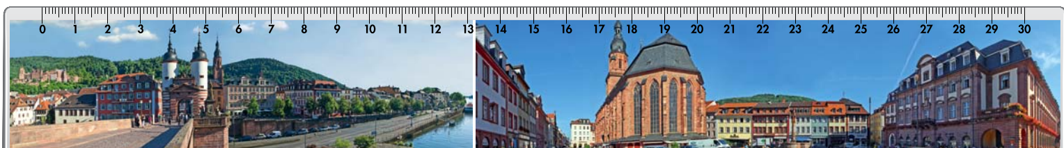
Motiv Nr. 3