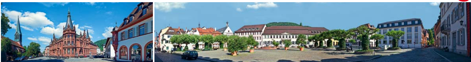
Linealrückseite mit Detailpanoramam