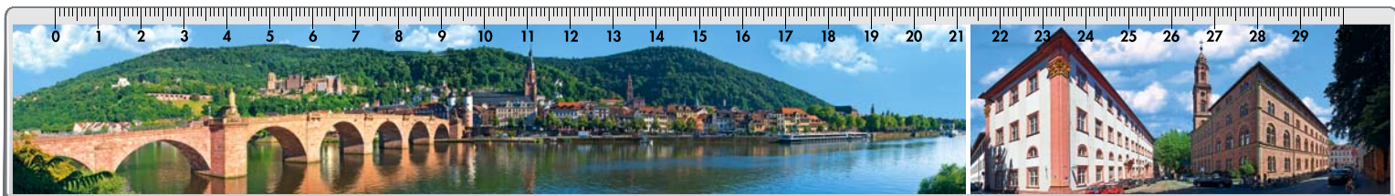
Motiv Nr. 2