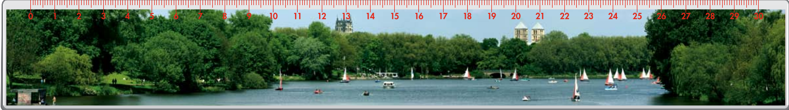
Motiv Nr. 2