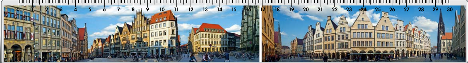
Motiv Nr. 3