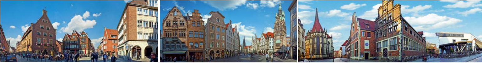
Linealrückseite mit Detailpanoramen